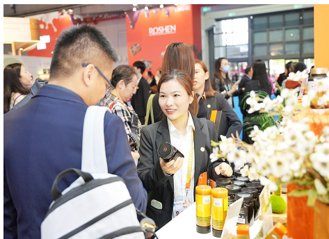
寻味进博会