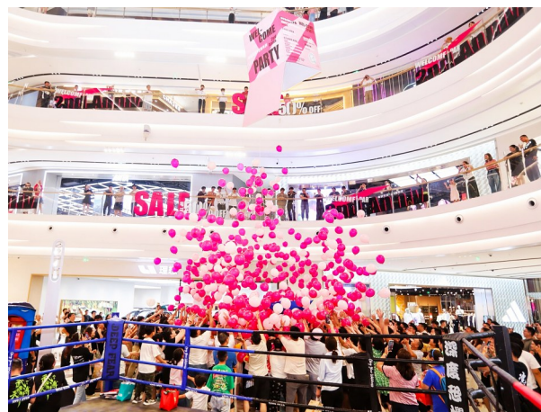
消费新场景