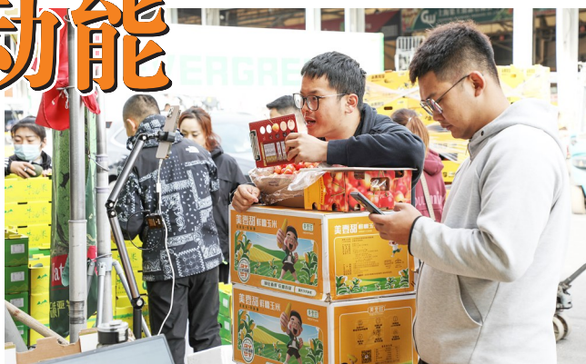
直播带货

在进博会期间,奉贤区相关企业积极参与,努力将展品变商品,丰富消费场景,为地区经济发展注入内生动力。