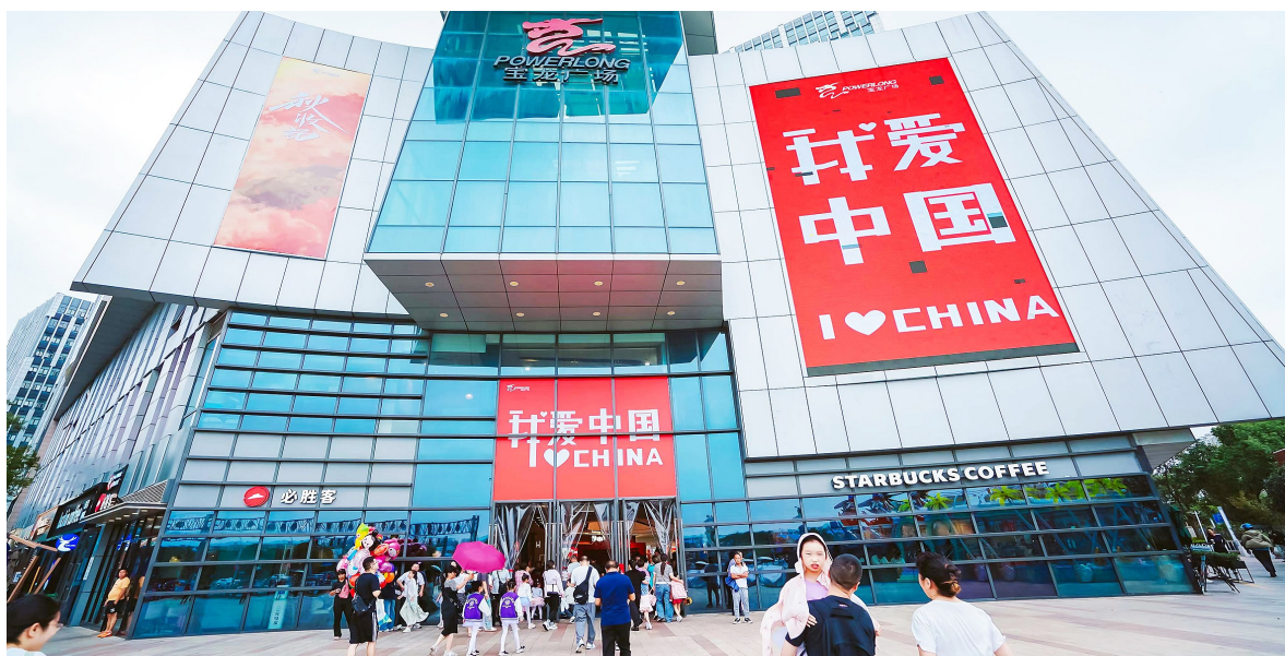
喜迎八方来客