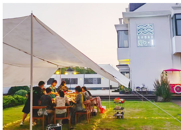
民宿小聚