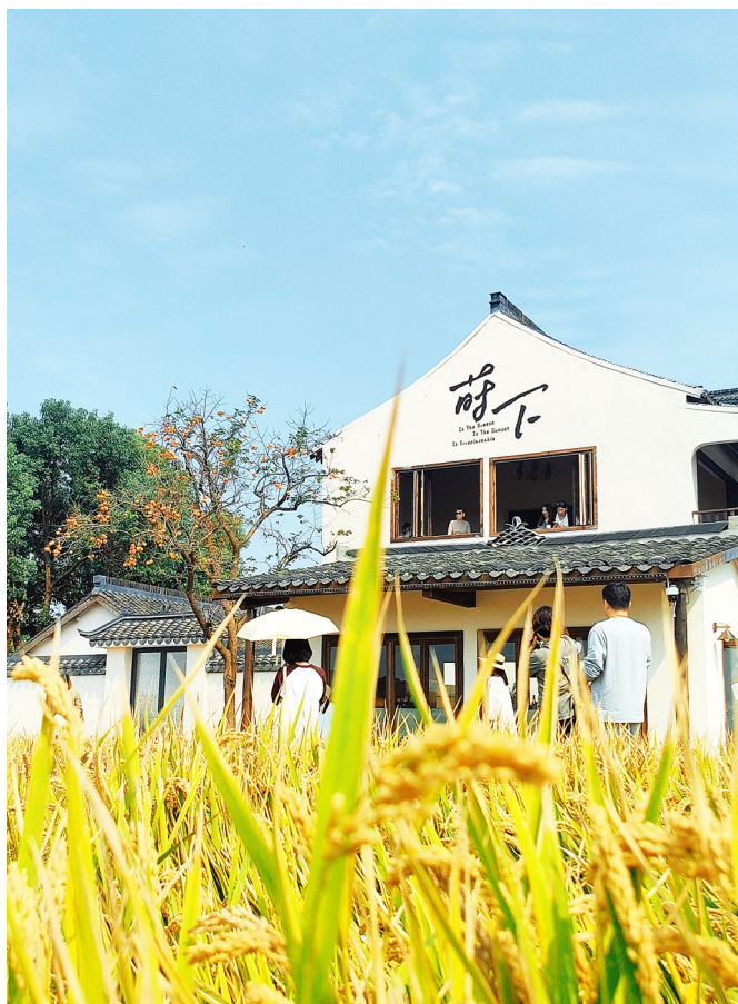
田间咖啡屋