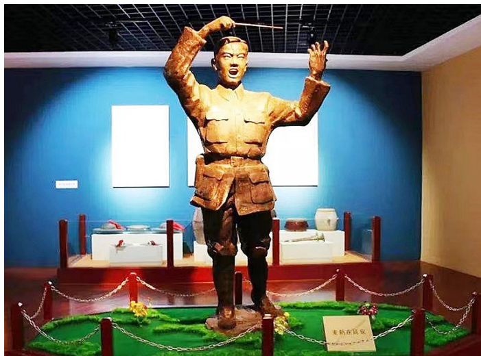
内蒙开鲁县麦新纪念馆里的麦新塑像

礼堂内（建国后先后为县银行、财政局、审计局办公地，地名改为“勤俭弄”，现已拆建为金叶大厦），这批文化人离开大城市相对安定舒适的工作生活环境，奔赴抗日前线，睡地铺、吃大灶，脱下西装长衫，换上戎装绑腿，早上六点出操，早饭后下连队下基层，晚上忙到深夜才休息。