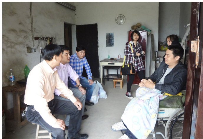
图为区镇走访慰问贫困残疾人家庭

保持康复耐心恒心 孤独症儿童的训练是一个长期而系统的干预工程,家长要有打持久战的准备,遵循其发展规律,始终保持耐心和恒心,在他们成长的全阶段开展训练矫治。