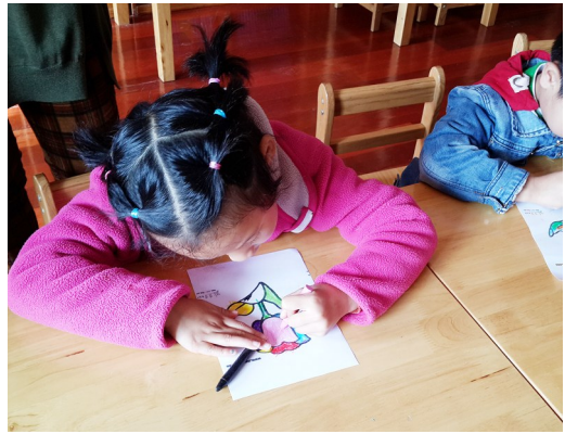
图为孤独症儿童康复训练