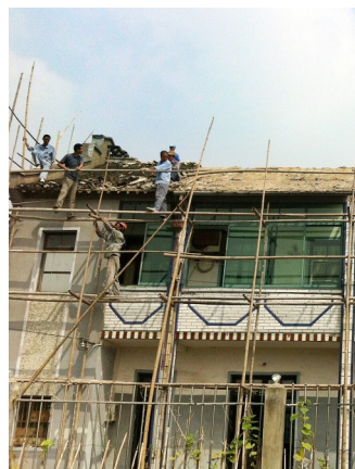
图为残疾人家庭住房修缮

从2014年至今,408户低保残疾人家庭已享受基本生活支出补助金共103.6万元。此项社会福利制度减少了残疾人生活支出,改善其生活质量,提升了残疾人幸福指数。符合条件的残疾人可到镇、社区、开发区残联申请2015年下半年的日常生活支出补助。